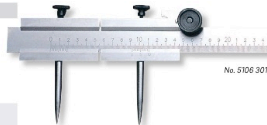
No. 5106 301