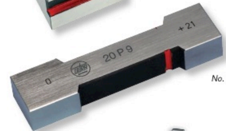
No. 1128 1..