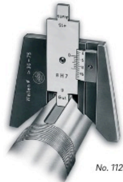
No. 1128 3..