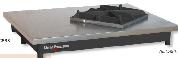
No. 1519 1.

Stabile Rippenkonstruktion Stable, ribbed design