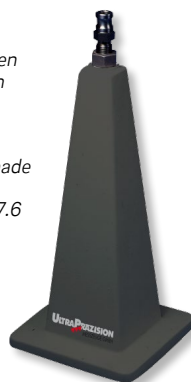
No. 1513 103

Levelling jacks and supporting feet made of special cast iron see pages 7.5 and 7.6