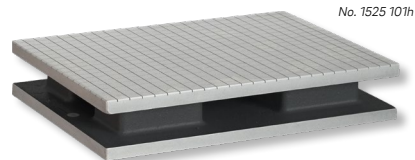
No. 1525 101h