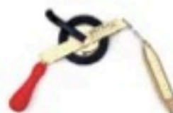
Bandablauf durch die Führung „F“ tape rolls out through the guide „F“