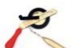
Bandablauf am Griff „G“ tape rolls out near the handle „G“