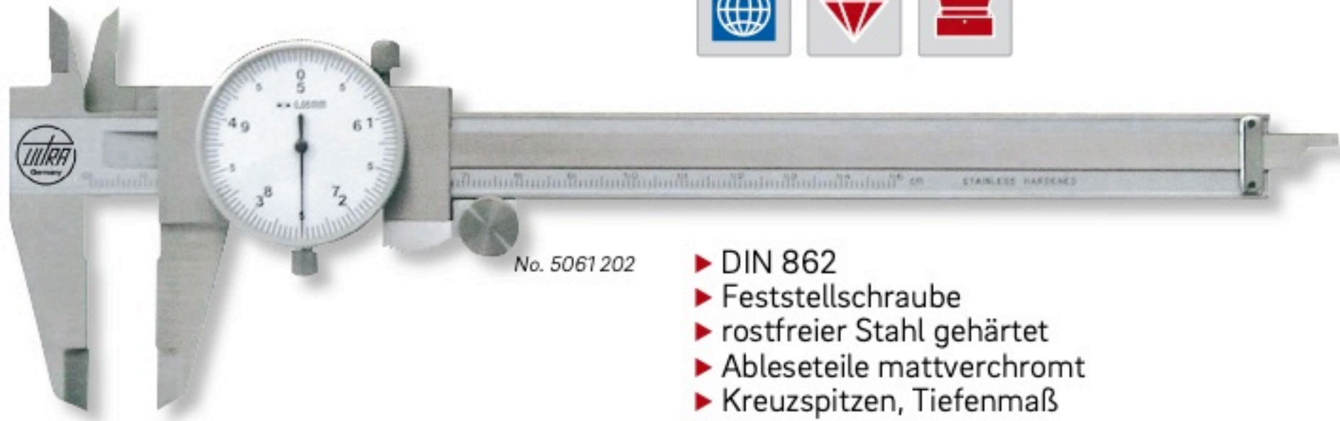
No. 5061 202