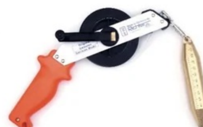
Bandablauf durch die Führung „F“ tape rolls out through the guide „F“