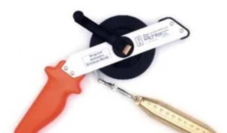
Bandablauf am Griff „G“ tape rolls out near the handle „G“