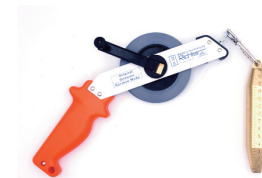
Bandablauf durch die Führung „F“ tape rolls out through the guide „F“