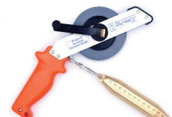
Bandablauf am Griff „G“ tape rolls out near the handle „G“