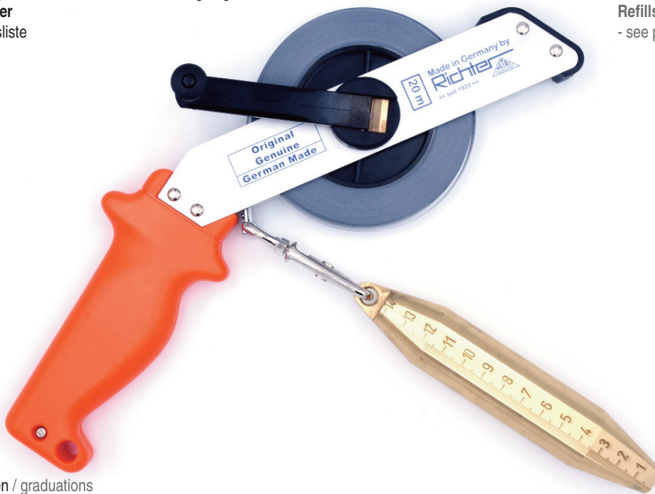
Maßteilungen / graduations